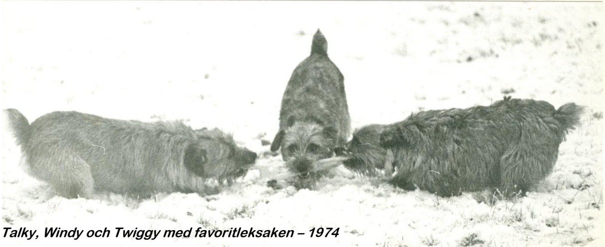
Talky, Windy och Twiggy med favoritleksaken – 1974

Alla tre gick vidare i aveln och den mest meriterade blev NORD U CH Cracknor Conspiracy